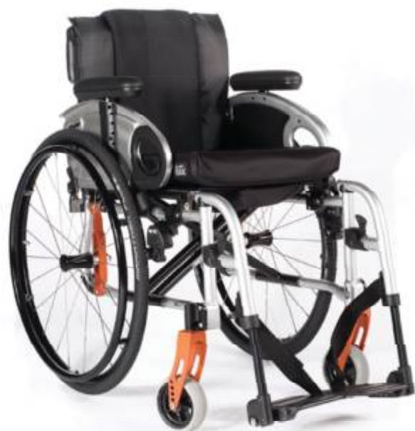
Quickie Life com apoio de pés desmontáveis Disponível com apoio de pés a 70° ou a 80°

Com múltiplas opções de configuração, para aqueles que não querem renunciar a nada.