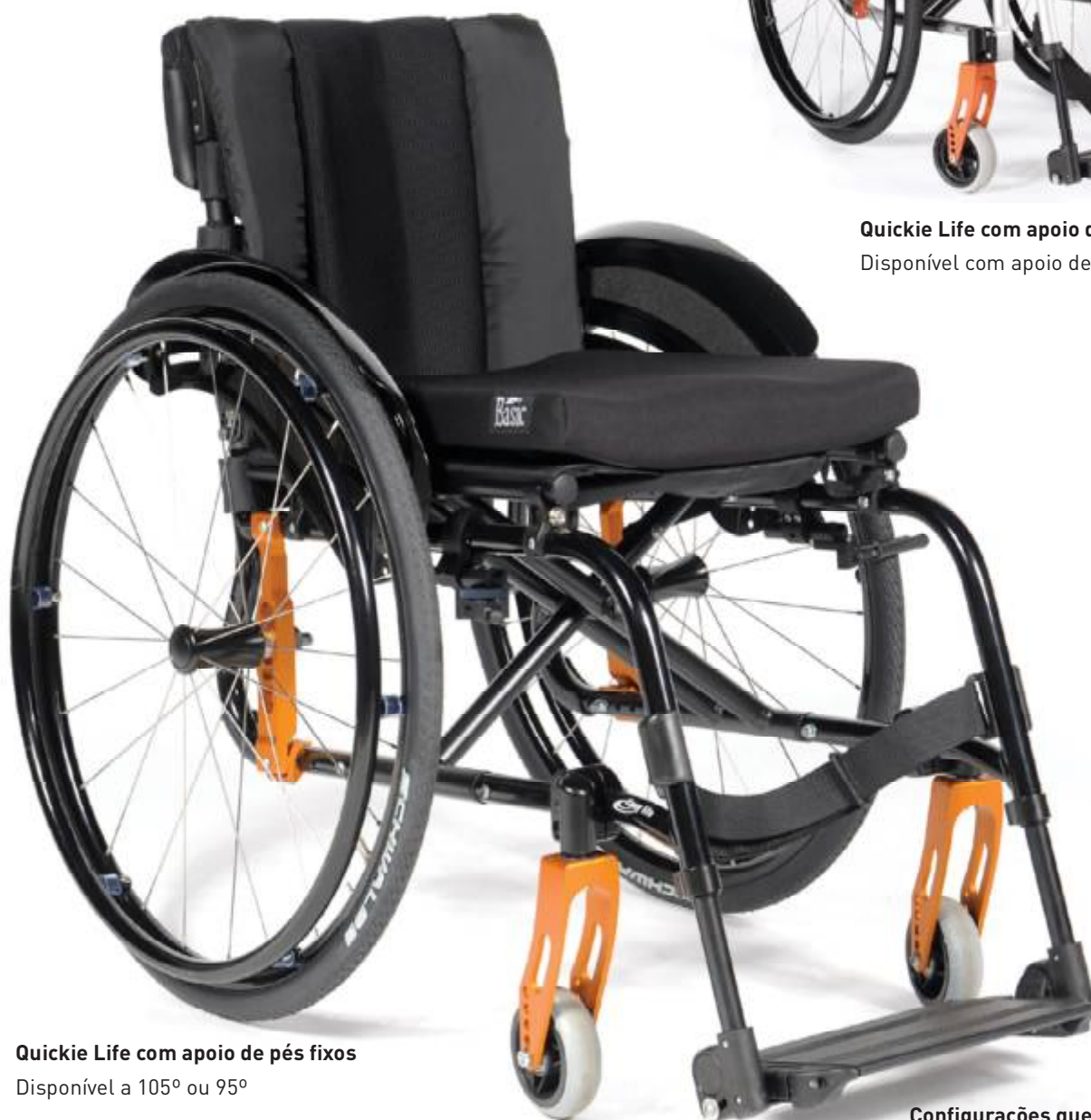
Quickie Life com apoio de pés fixos Disponível a 105° ou 95°